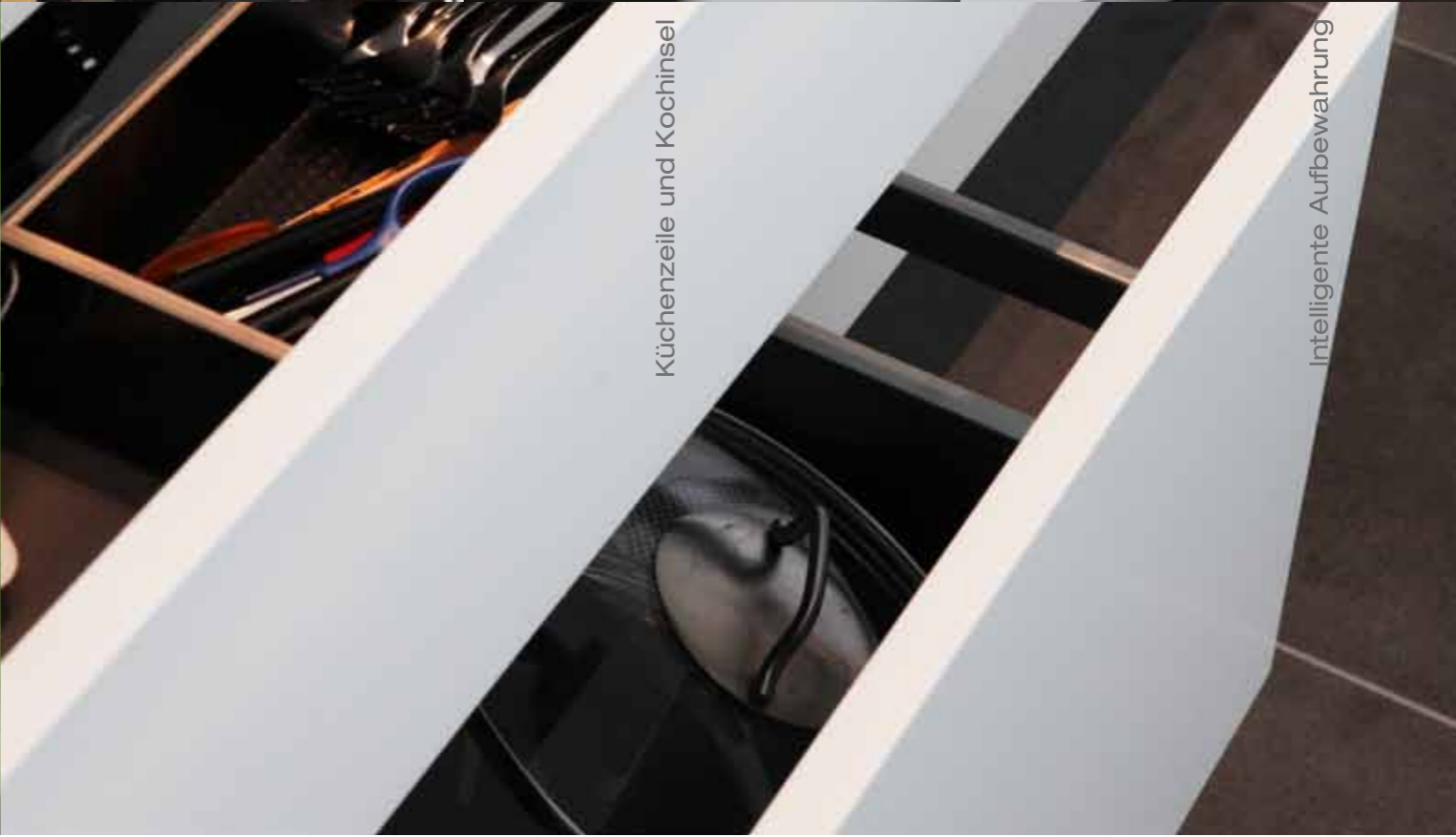
Küchenzeile und Kochinsel