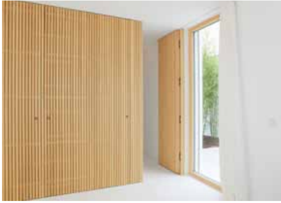
Tür zum Gästebad: flächenbündig mit der Front des Einbauschranks