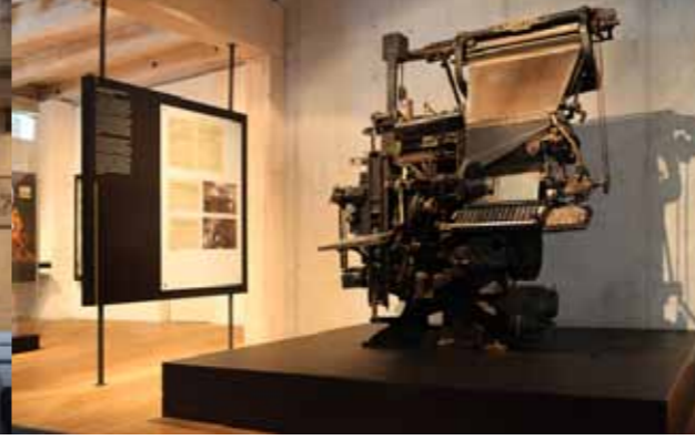
Schwerlastpodest nach statischer Berechnung für die Druckmaschine