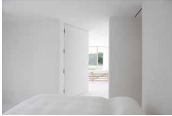
Schlafzimmer mit überbreiter, putzbündiger Türe, Öffnungswinkel 180°