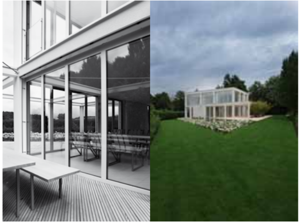
Terrasse, Essstischkombination und Eingangsbereich