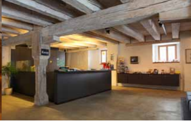
Empfangstresen und hängendes Sideboard