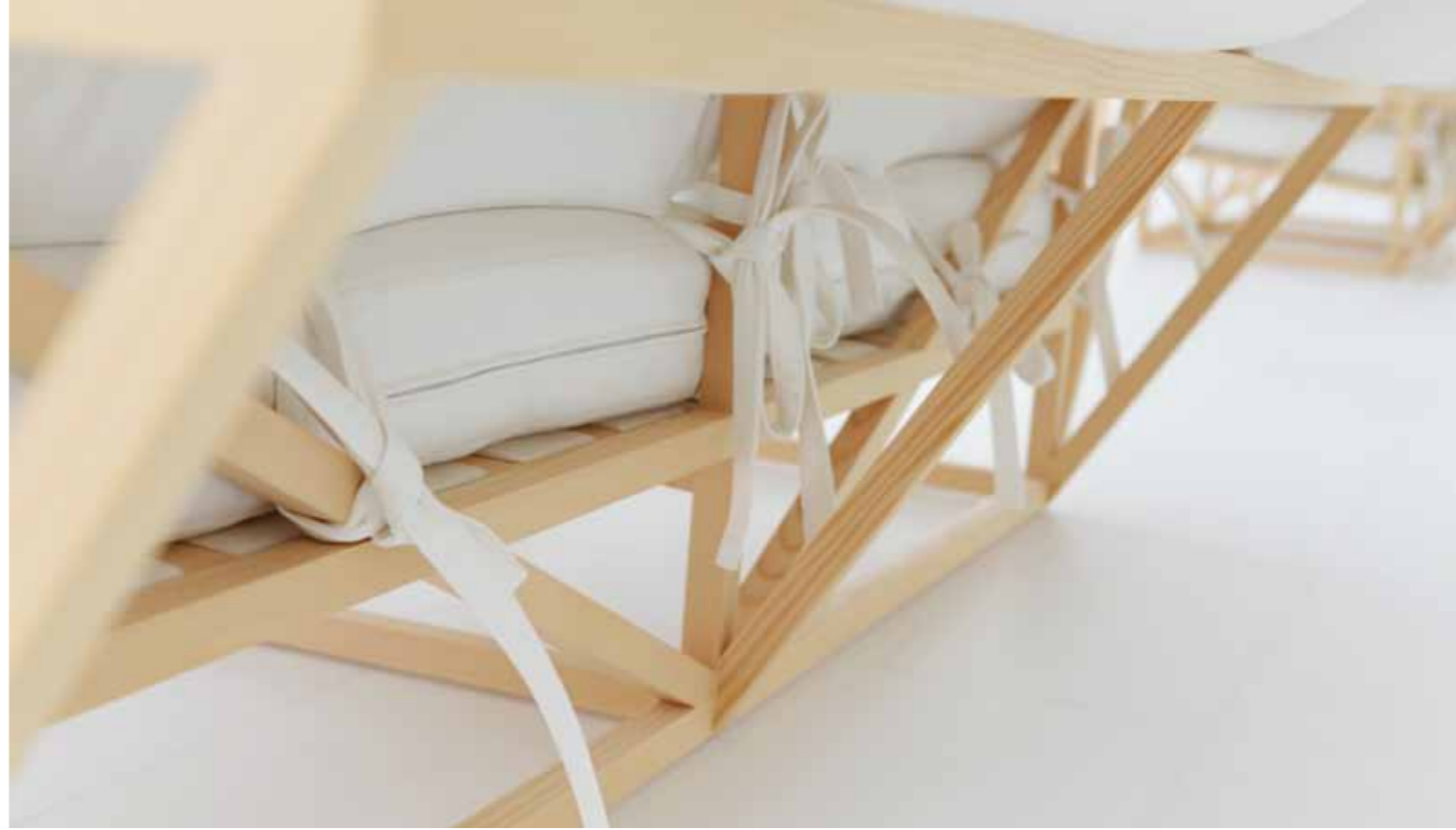
Sichtbare Statik: Mit Gurten bespannte Gestelle für die Kissen