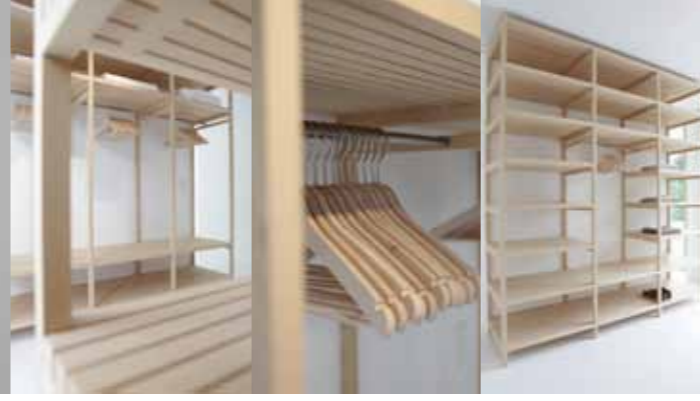
Offenes Kleiderregal aus Leitern mit Ablagen aus auf Gratleisten fixierten Leisten