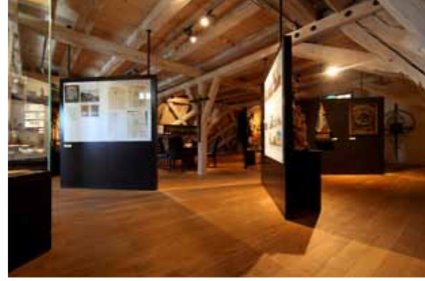
Infotafeln aus schwarz durchgefärbtem MDF mit Glaseinsätzen