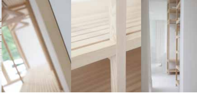
Spiegel mit Hublift hinter Trockenbauwand mit innenliegenden Regal