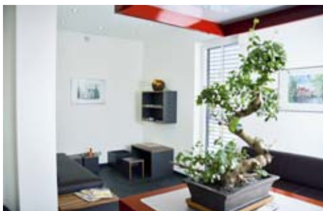
Ein mittig geöffneter Korpus im Warteraum wird als Dekofläche genutzt