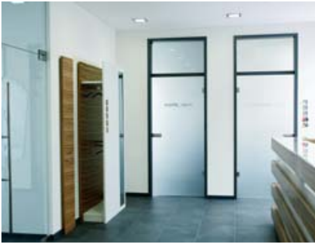
Der warme Holz kontrastiert mit dem Graphitton des Bodens