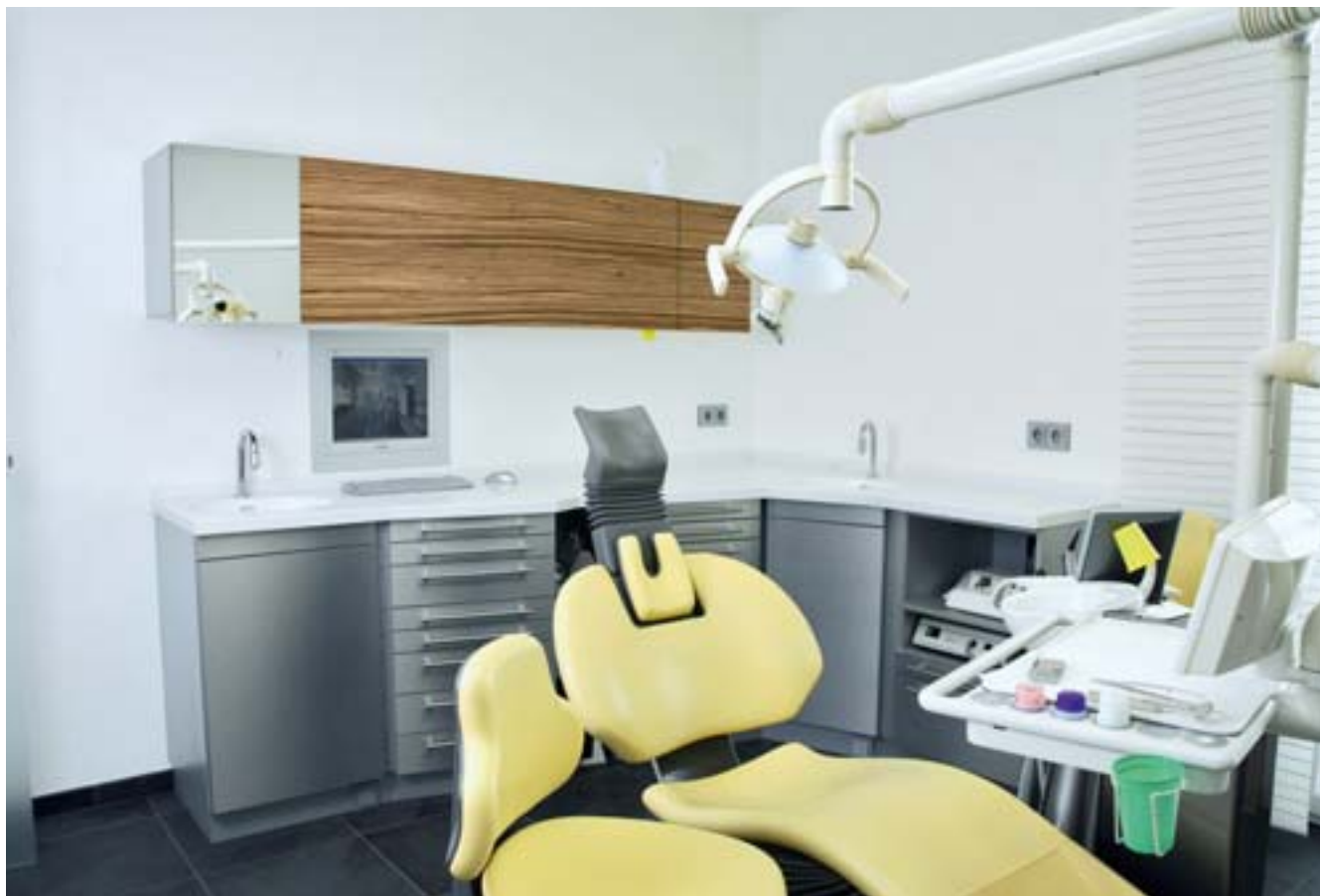
Schrankzeile im Behandlungszimmer: kurzer Zugriff auf alle benötigten Utensilien