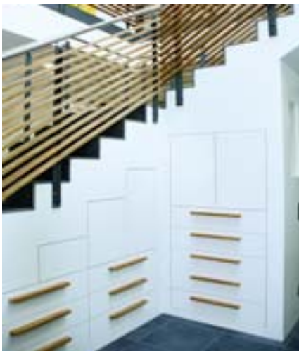
Der Treppenunterschrank ist absolute Maßarbeit

den Treppenstufen ab. Alle Türen sind grifflos und öffnen sich durch leichtes Antippen. Nur die Vorderstücke der Karteiauszüge wurden mit horizontalen Griffleisten in Zebrano ausgeführt. Sämtliche Anschlüsse wurden vor Ort