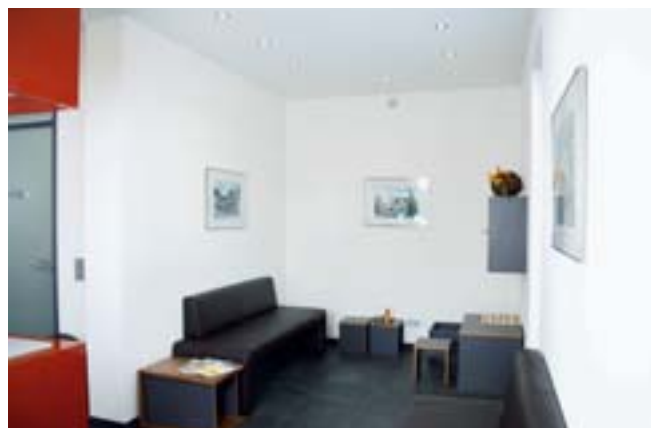
Warteraum: die Möbel sind in anthrazitfarbenem Schichtstoff gehalten

angepasst und geklebt. Der Unterschrank ist von beiden Seiten her zugänglich, die Korpusse für den vorderen und hinteren Bereich wurden getrennt gefertigt, um Masstoleranzen der Beton- treppe bzw. des Belages auszugleichen.