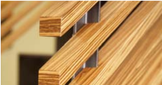
Geländer: komplexer als zunächst gedacht